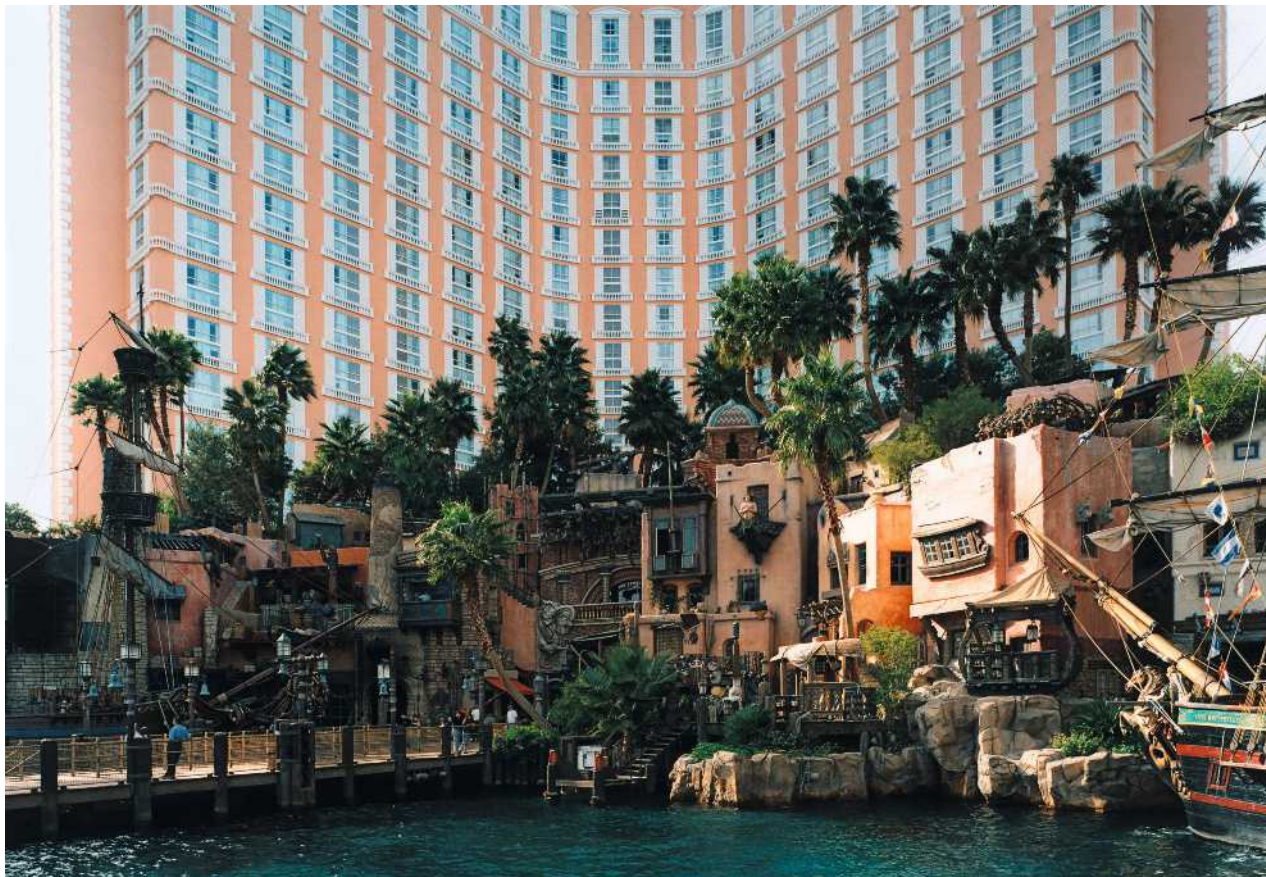
Palmen für die wilde Illusion: Thomas Struths »Las Vegas 1, Las Vegas, Nevada« von 1999

COVER: Sheila Hicks, „Palm Tree“, 1968 (Detail), © VG Bild-Kunst, Bonn 2021, Foto: Mark Darley/bpk/The Metropolitan Museum of Art; Bild rechts: © Thomas Struth